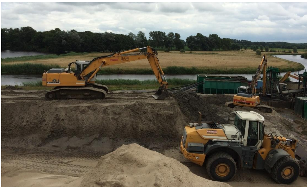
Grondverzet voor reiniging

De certificaathouder moet een overzicht bijhouden van de vastgestelde hogere maximale acceptatiewaarden voor de fysisch/chemische samenstelling alsmede van de onderliggende bewijsmiddelen op basis waarvan de grond/baggerspecie toch kan worden gereinigd respectievelijk geïmmobiliseerd.